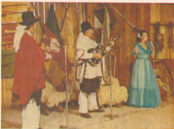
Apresentação no CTG 35 em Porto Alegre