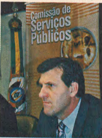
Sossela apresentou o requerimento da reunião ordinária da Comissão de Serviços Públicos.

A decisão da Justiça Federal do Paraná abre jurisprudência e faculta a qualquer cidadão a tomar a iniciativa, caso julgue estar sendo prejudicado, em ingressar com ações judiciais contra os abusos contratuais entre governos e concessionárias de praças de pedágios.