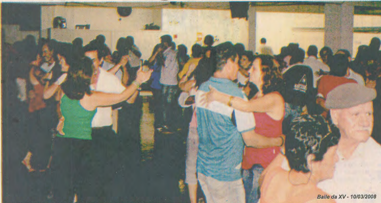
Baile da XV - 10/03/2008