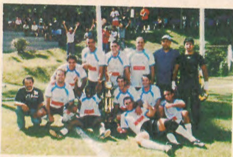
ADULTA SÉRIA B