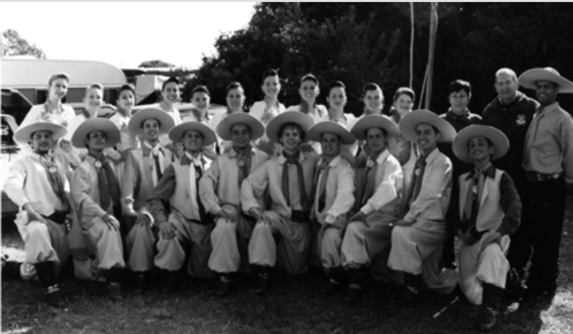
19 ° RODEIO CRIOULO INTERNACIONAL TRAMANDAÍ/RS - MAIO DE 2006