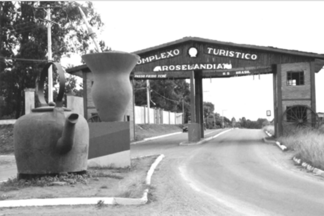
PARQUE DE RODEIOS ROSELÂNDIA - PASSO FUNDO/RS