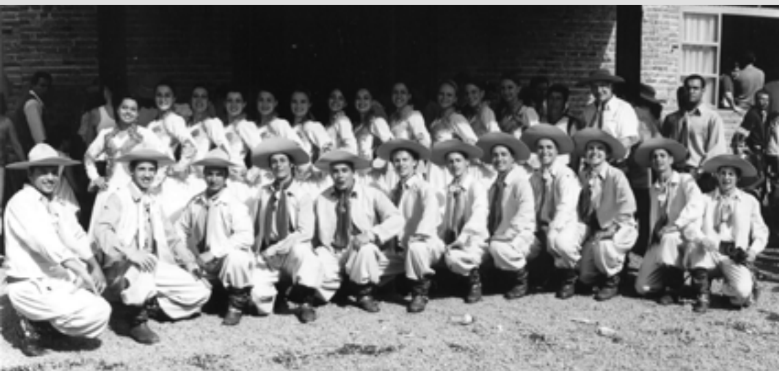
INVERNADA DE DANÇAS ADULTA DO LALAU MIRANDA RODEIO CRIOULO NACIONAL - VERANOPOLIS EM 2006