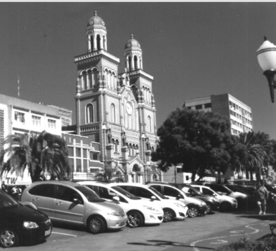
IGREJA CATEDRAL - PASSO FUNDO/RS