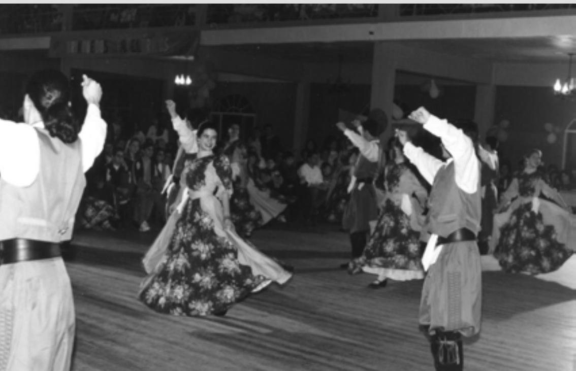
PRENDAS E PEÕES APRESENTANDO DANÇAS TRADICIONAIS GAÚCHAS NO CTG LALAU MIRANDA.