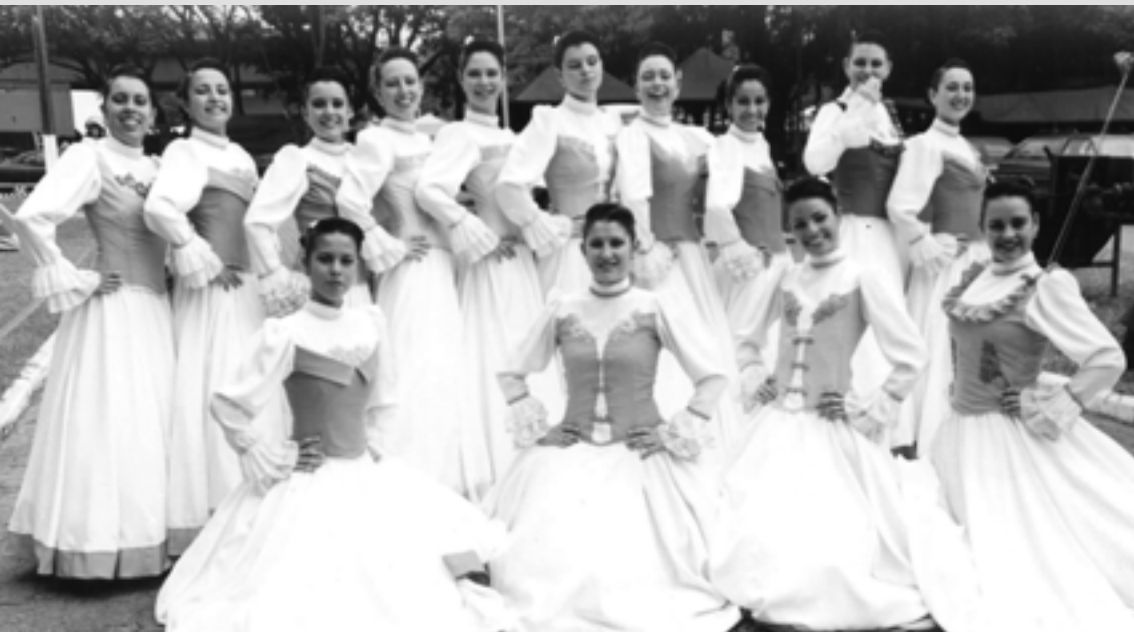
PRENDAS DO LALAU MIRANDA NO ENART 2003