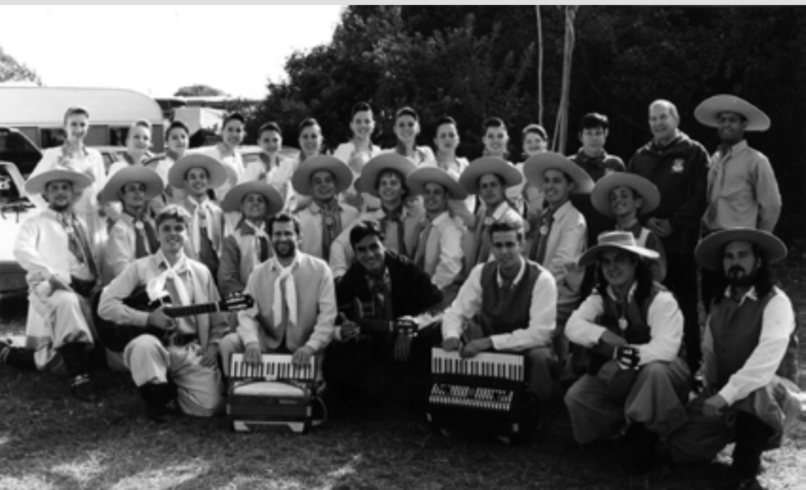
CONJUNTO MUSICAL DO CTG LALAU MIRANDA