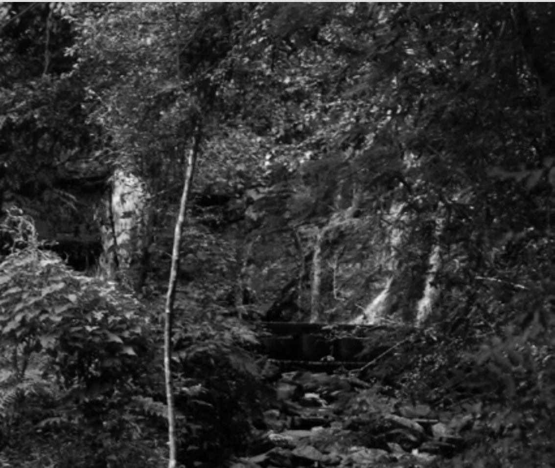
CACHOEIRA DO PAPAGAIOS