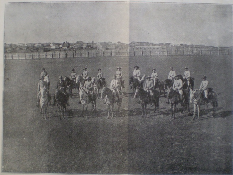
Commandante e officaes do 6º corpo, em companhia do Intendente Municipal.