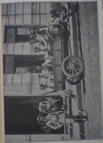
Caminhão á frente da Intendencia Municipal, por occasião do sitio, conduzindo soldados do 6º corpo para as linhas de defesa.