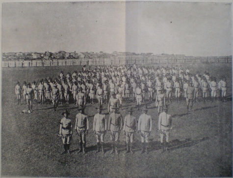
Formatura do 6º corpo.