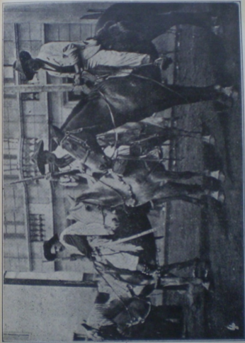
Defesa da cidade Grupo de civis, á frente da Intendencia, por occasião do sitio da cidade.