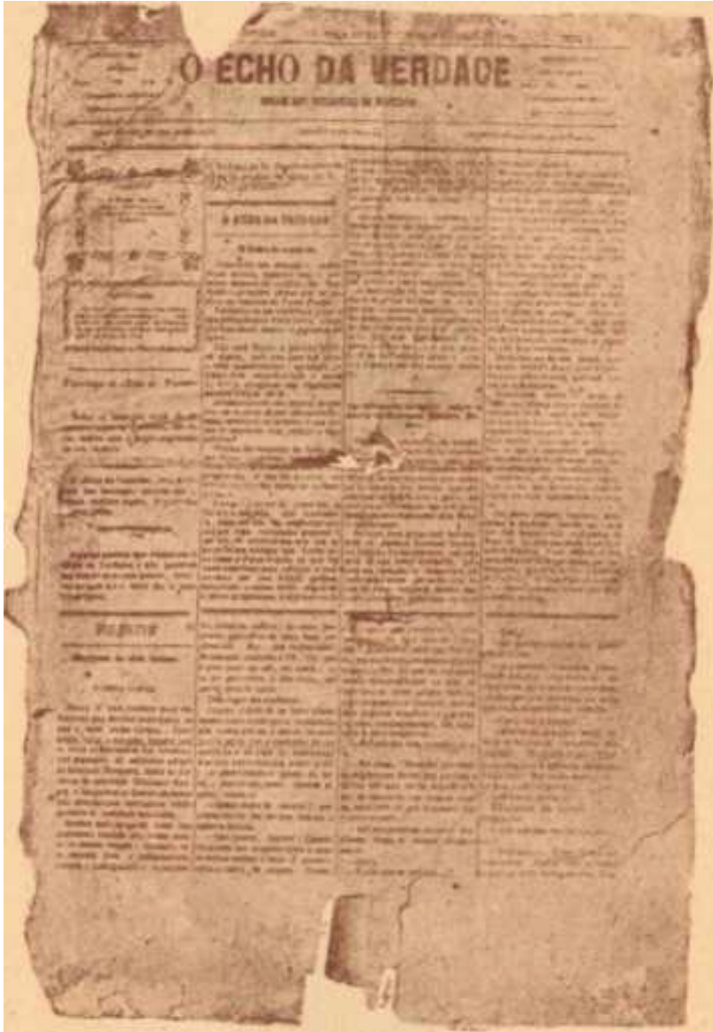
Primeiro numero do "Echo da Verdade"