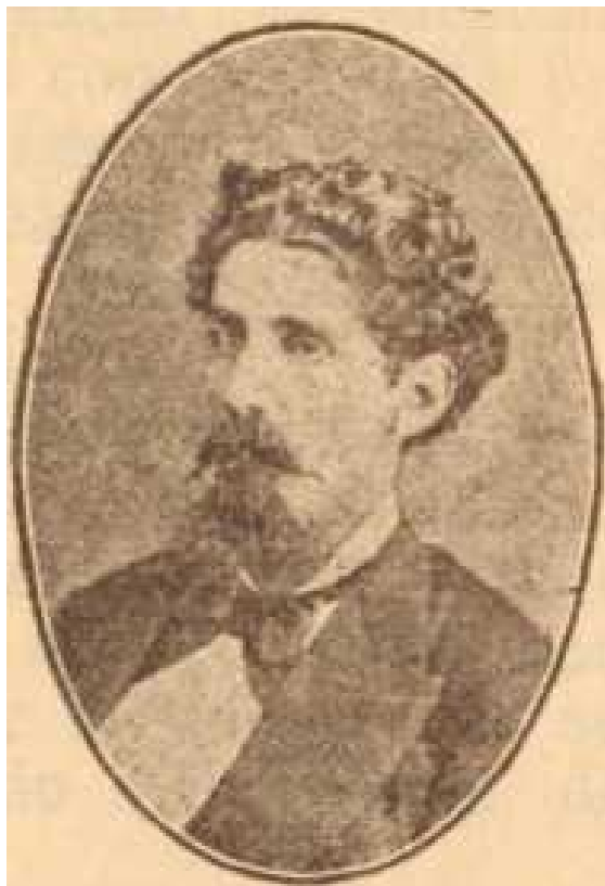
Capitão João de Vergueiro